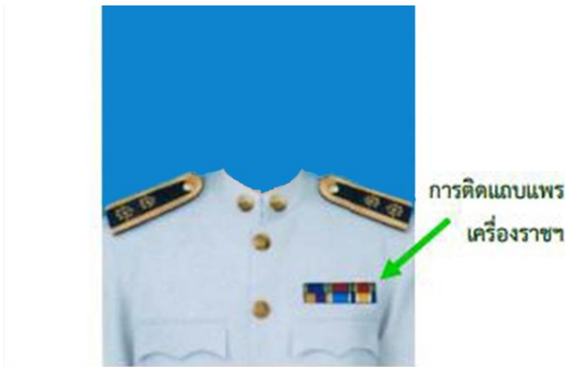
พนักงานราชการชาย