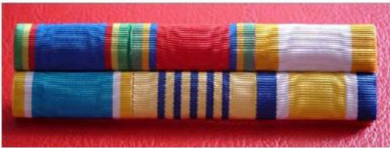
แพรแถบเครื่องราชฯ ทำด้วยผ้าแพรแถบ ไม่มีพลาสติกหุ้มติดที่หน้าอกเหนือกระเป๋าใต้ชาย ประมาณ 0.5 เซนติเมตร